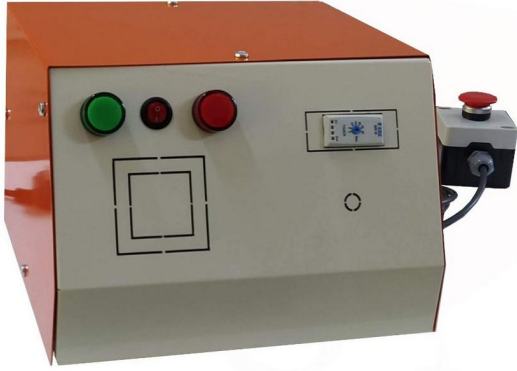
1.1 Dezenfektan Püskürtme Cihazı