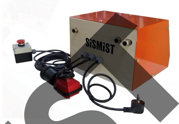
1.2 Dezenfektan Püskürtme Cihazı