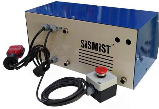
2.2 Dezenfektan Püskürtme Cihazı